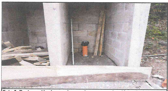
Foto 5: Restauración de paredes y columnas, conducciones de drenaje, corrección de fugas y accesorios y sanitarios.