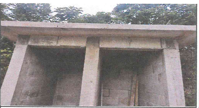
Foto 6: Sustitución de techo por terraza, para la colocación de tinaco para depósito de agua.

Observación: Si es necesario se pueden agregar hojas adicionales y actualizar el número de hojas.