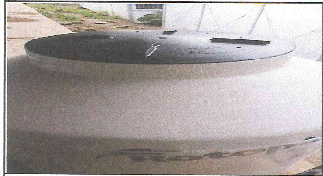
Foto 3: Compra de rotopláts para almacenaje de agua de sanitarios y servicio durante la obra.