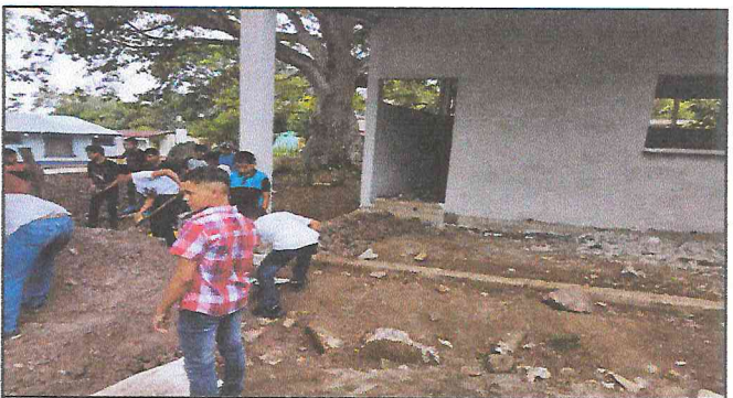
Foto 4: Acarreo y compactación de selecto por los jóvenes, para la fundición de torta de concreto.